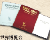
世界博覧会登録報告書

「外灘ミニチュア模型」外灘建築の1:200比率により造られた外灘ミニチュア模型で、復元図中の風景は1940年代の外灘景観を再現しました。